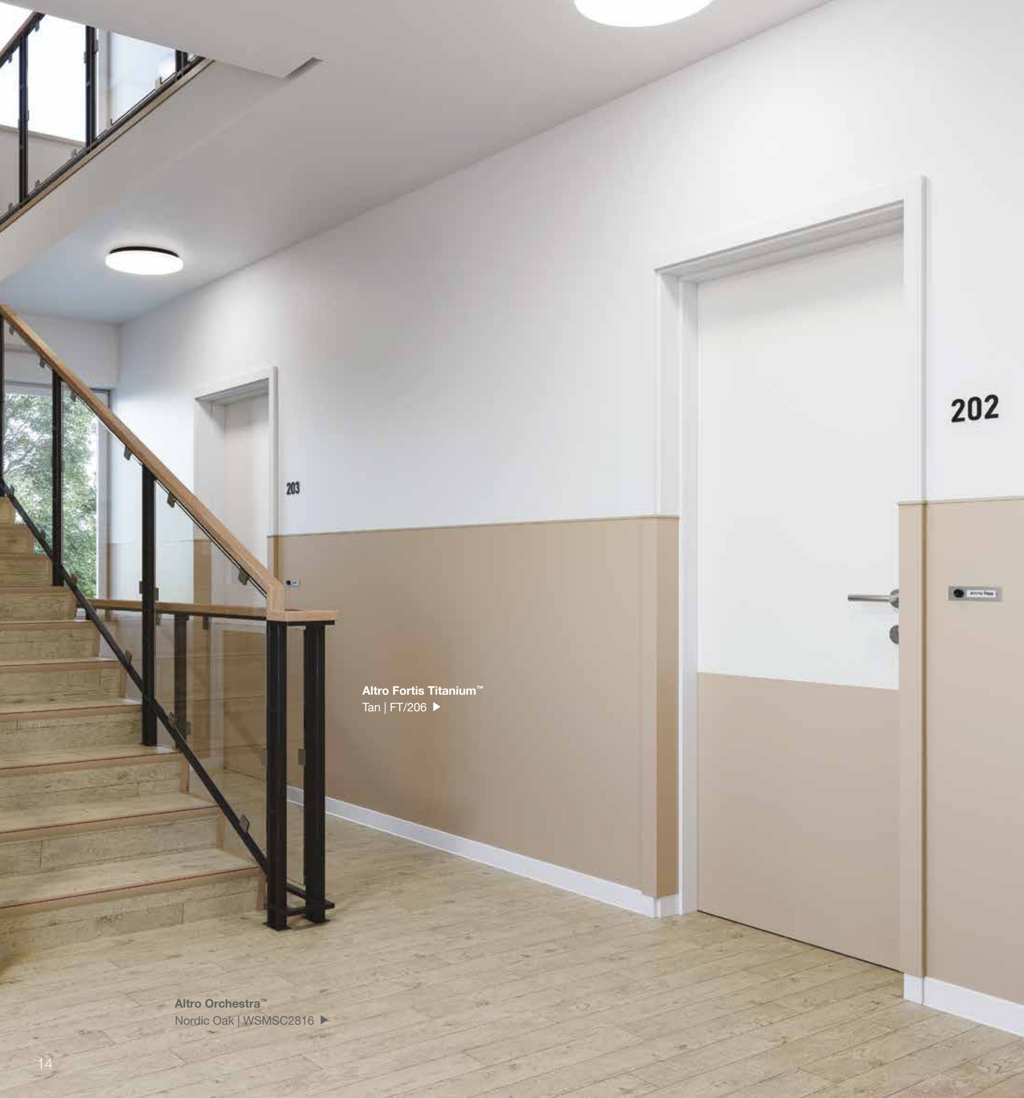
Altro Fortis Titanium™ Tan | FT/206 ▶