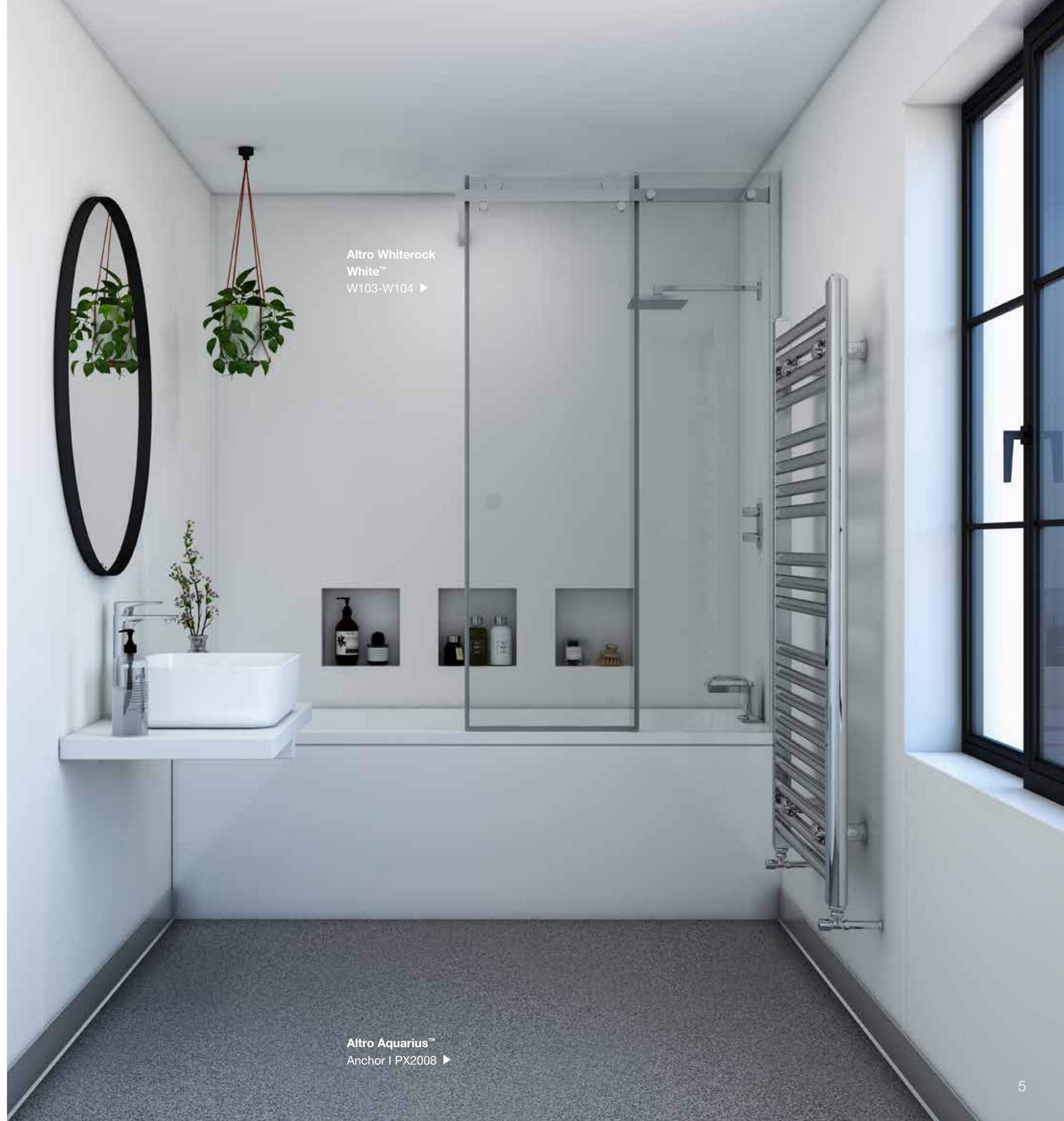
Altro Whiterock White™ W103-W104 ▶

Altro Aquarius ist mit der Altro Easyclean™ Technologie ausgestattet, die einen geringeren Reinigungsaufwand erfordert.