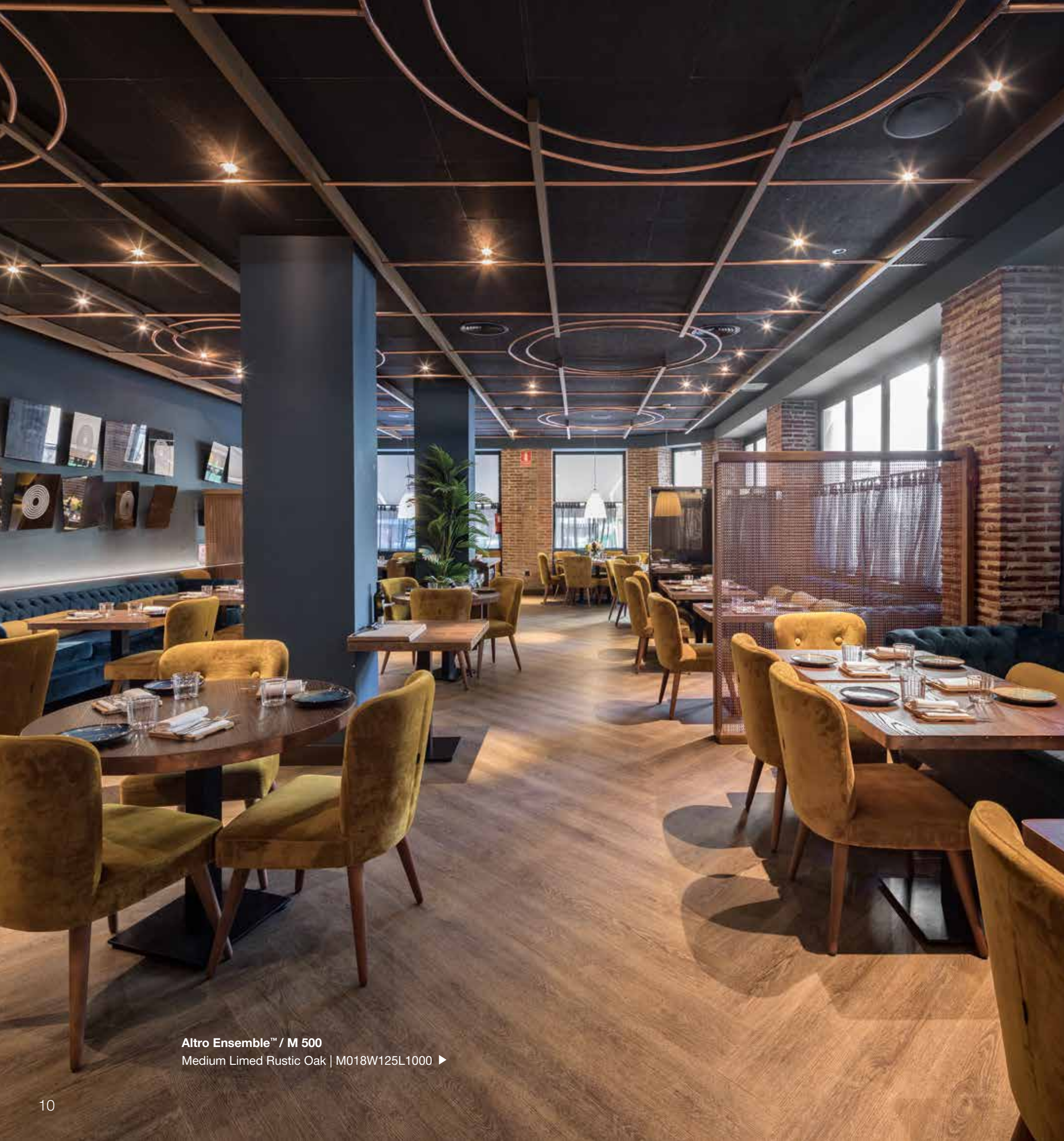
Altro Ensemble™ / M 500 Medium Limed Rustic Oak | M018W125L1000 ▶