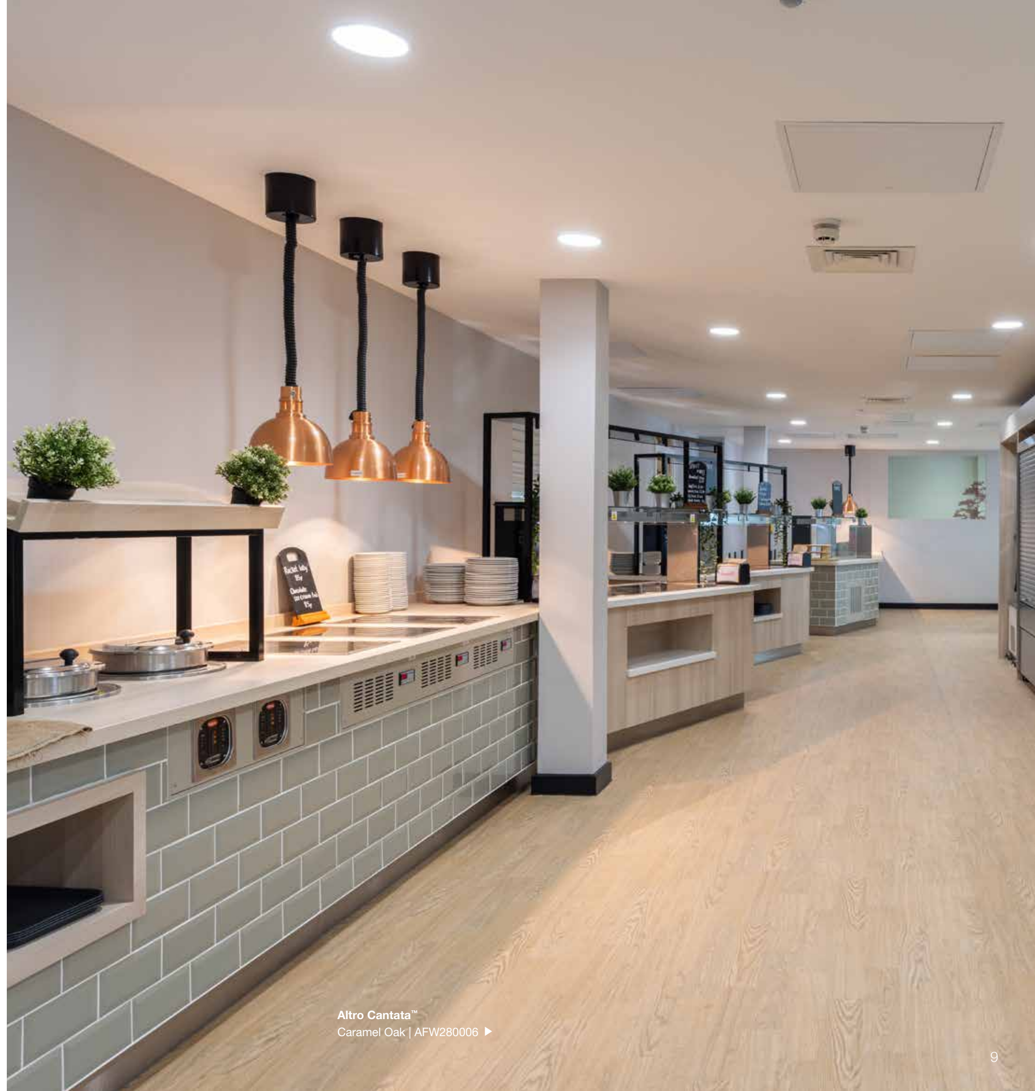
Altro Cantata™ Caramel Oak | AFW280006 ▶

Altro erfand den Sicherheitsbodenbelag und ohne Klebstoff zu verlegende Sicherheitsbodenbeläge.